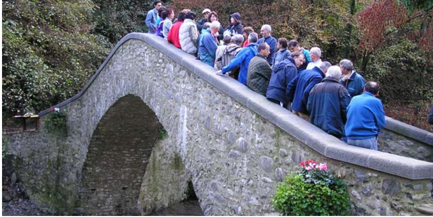
Sopra: i marciatori alla partenza sul "Pontaccio", e all'arrivo nella piazza di Trassilico.